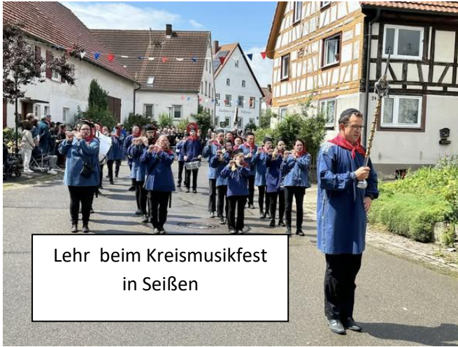
Lehr beim Kreismusikfest in Seißen