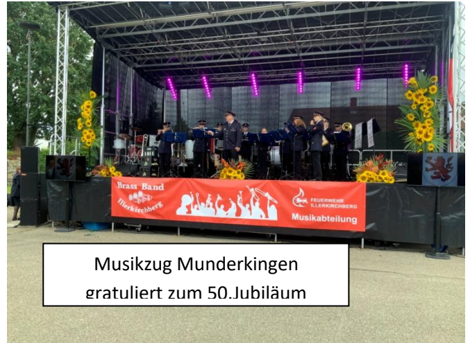
Musikzug Munderkingen gratuliert zum 50. Jubiläum