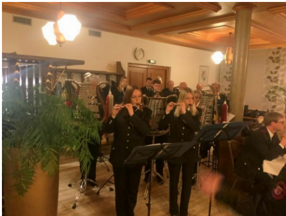
Hauptversammlung Feuerwehr Munderkingen

Im Berichtsjahr zeigten die Musikerinnen und Musiker ihr musikalisches Können bei 19 Veranstaltungen jeweils in der eigenen Wehr. Dabei wurden Feuerwehrveranstaltungen wie Jahreshauptversammlungen musikalisch umrahmt oder musikalische Events von den Musikabteilungen des Kreisfeuerwehrverbandes gestaltet.