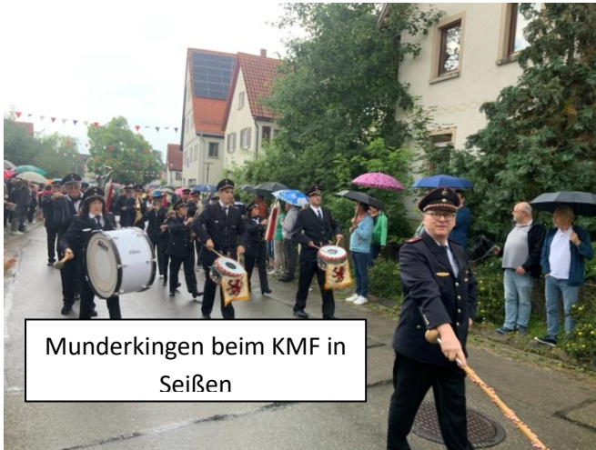
Munderkingen beim KMF in Seißen