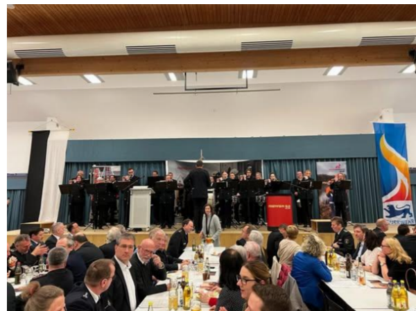
Hauptversammlung Feuerwehr Ulm