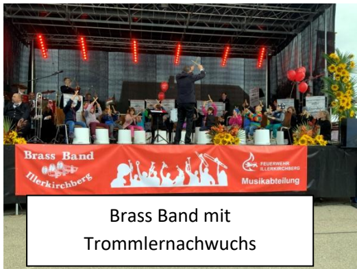
Brass Band mit Trommlernachwuchs