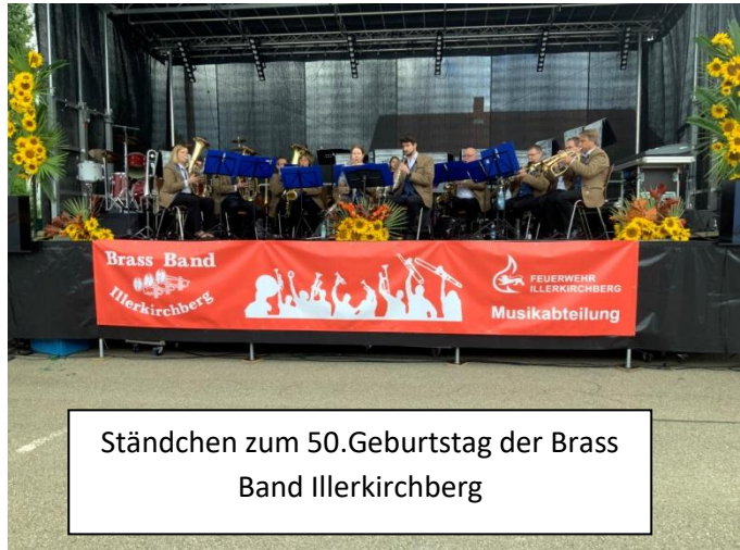
Ständchen zum 50.Geburtstag der Brass Band Illerkirchberg