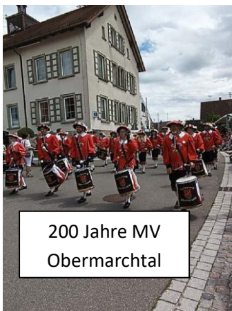
200 Jahre MV Obermarktal