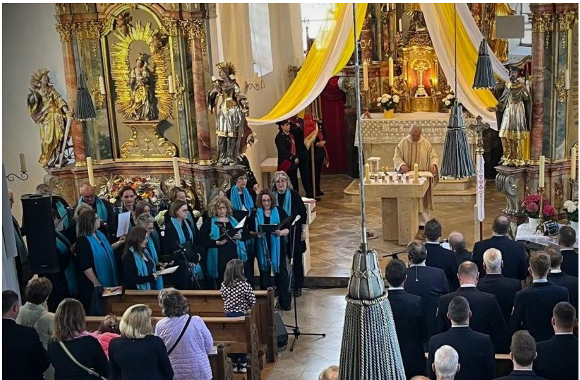
Landesflorianmesse in Nusplingen