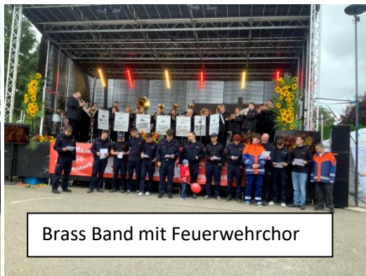
Brass Band mit Feuerwehrchor