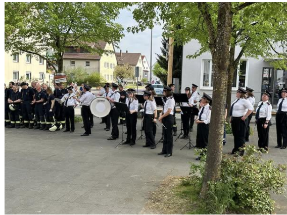
Maibaumaufstellen der Feuerwehrabteilung