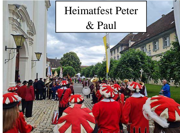
Heimatfest Peter & Paul